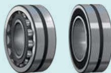
Наклонная камера / ротор молотилки