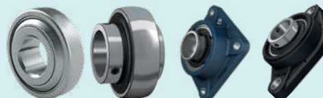
Устройство очистки / разгрузочный шнек