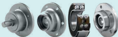
Узлы Agri Hub