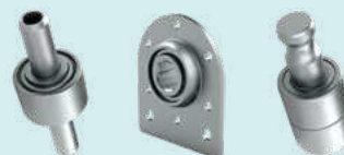
Приводной вал высевающего аппарата